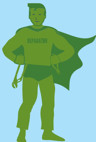
Reparatører er superhelter

Miljøpartiet De Grønne tar forskerne og klimastreikerne på alvor, og vil møte miljøkrisa verden står overfor med grep som monner. Alle kan være med på arbeidet med å lage et trivelig og miljøvennlig lavutslippssamfunn.