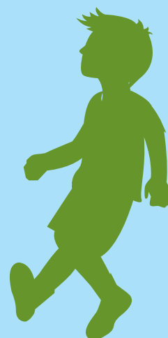
La barna leke

Alle familier skal ha rett på barnehageplass i nærmiljøet sitt. Vi jobber for svømmehall på Tangvall, og nytt bibliotek øst for Varoddbroa. Miljøpartiet De Grønne vil ha en skole med mindre stress og prøver, og forsøk med karakter-frie perioder i ungdomsskolen. Vi støtter skolehager og annen praktisk læring.