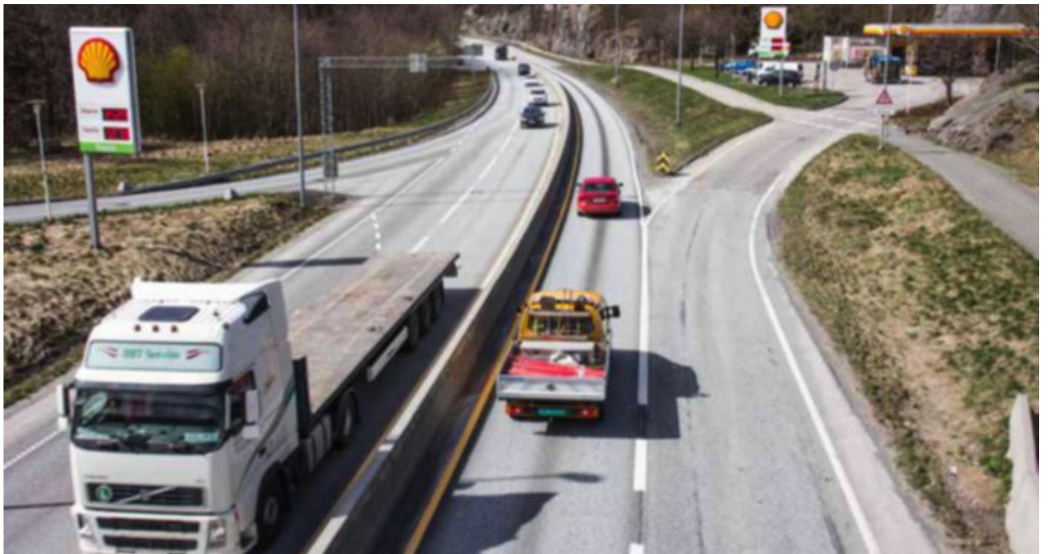
Høyre og FrP er i ferd med å gjøre en gigantisk tabbe, skriver artikkelforfatteren om de nye veiplanene.

Dessverre jobber Høyre og Fremskrittspartiet hardt for å satse på gårdsdagens løsning: Ny motorvei. Dette vil øke biltrafikken i Kristiansand og dermed øke utslippene av klimagasser. Hensikten er å kunne kjøre i 110 kilo-